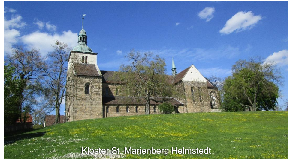
Kloster St. Marienberg Helmstedt

Die Schlussetappe führt Sie auf dem Eulenspiegel-Radweg über Berklingen in die Asse und dann über Gr. Denkte zurück zum Ausgangspunkt der Tour nach Wolfenbüttel.