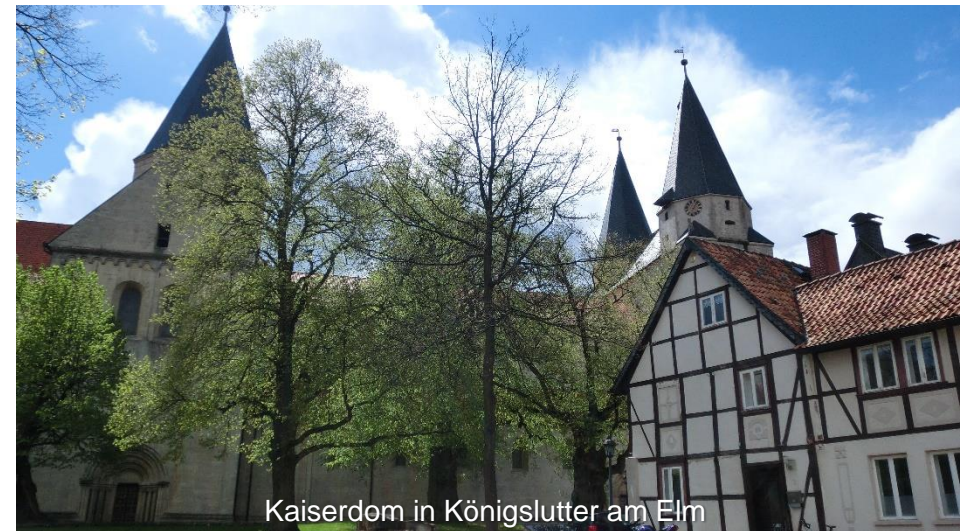
Kaiserdom in Königslutter am Elm

Übernachtungsvorschlag: https://hotel-braunerhirsch.de/