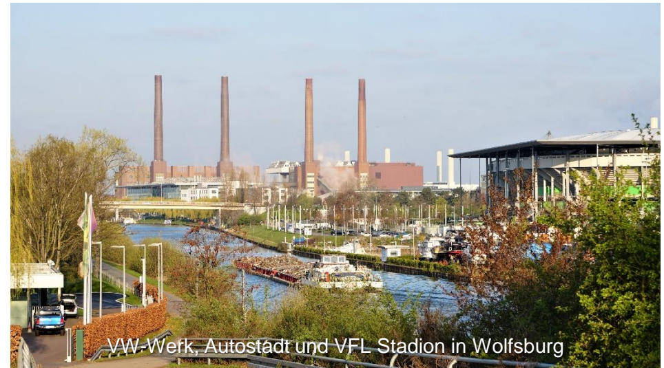
VW-Werk, Autostadt und VFL Stadion in Wolfsburg

Übernachtungsvorschlag: https://www.kaerntner-stubn.de/