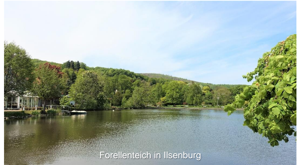
Forellenteich in Ilsenburg

Übernachtungsvorschlag: https://www.halberstaedter-hof.com