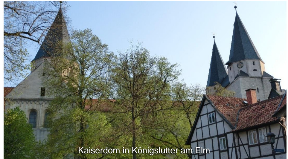
Kaiserdom in Königslutter am Elm

Der zweite Tag der Tour beginnt mit der Besichtigung von paläo, Tagebauinformationspunkt und dem Grenzdenkmal Hötensleben, bevor es weiter in Richtung Helmstedt geht.