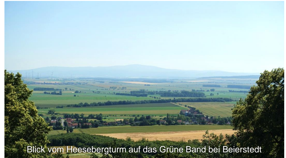
Blick vom Heesebergturm auf das Grüne Band bei Beierstedt

Die Schlussetappe der Tour mit ca. 20 km führt Sie durch den Drömling und vorbei am Schloss Wolfsburg zurück zum Ausgangspunkt der Tour in Wolfsburg.