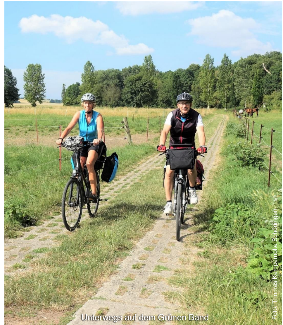
Unterwegs auf dem Grünen Band