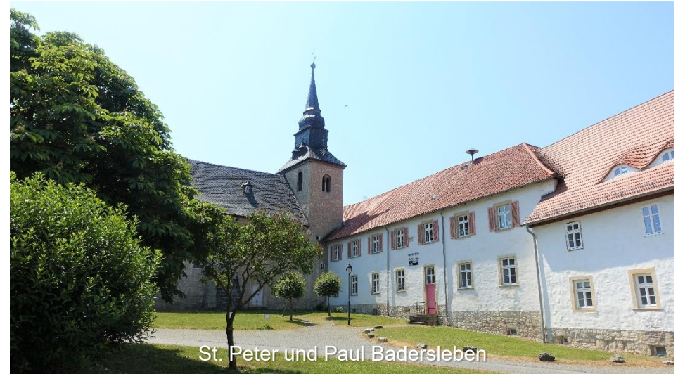
St. Peter und Paul Badersleben

Aus dem Großen Bruch führt die Tour anschließend hinauf nach Pabstorf um dann auf dem Telegraphenradweg, mit einem herrlichen Blick auf Huy und Harz im Süden und dem Elm im Norden nach Aderstedt zu fahren.