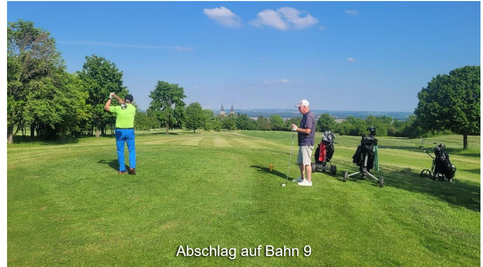
Abschlag auf Bahn 9

Diejenigen, die ihr kurzes Spiel verbessern möchten, finden auf dem 9-Loch-Kurzplatz perfekte Trainingsbedingungen.