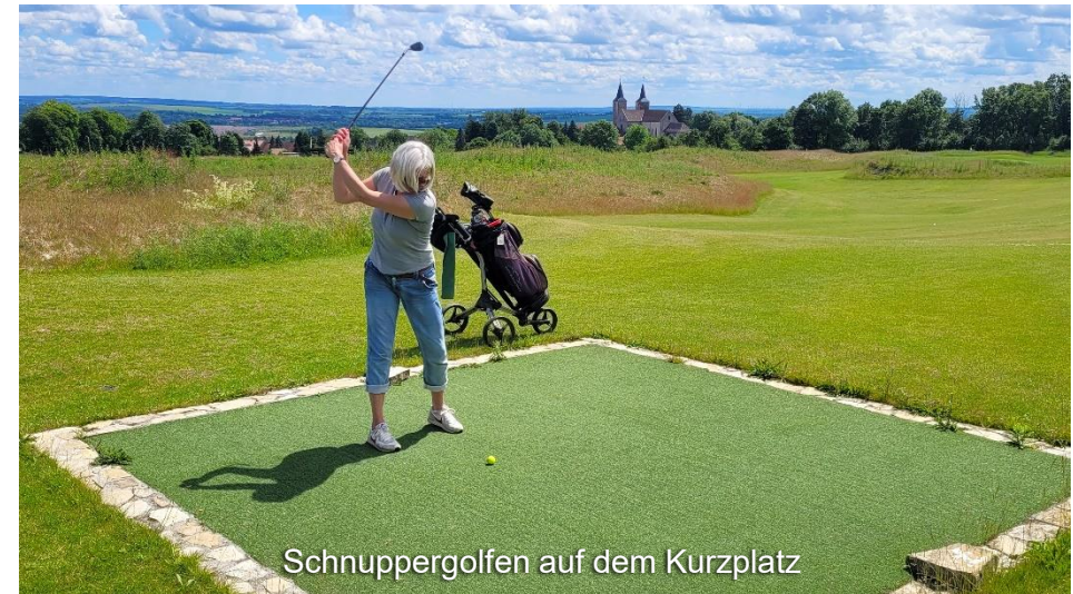
Schnuppergolfen auf dem Kurzplatz