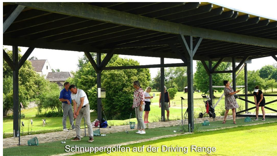
Schnuppergolfer auf der Driving Range

Nach diesem abwechslungsreichen auf dem Klostergut St. Lorenz, führt die Tour in entgegengesetzter Richtung zurück zum Wasserschloss Westerburg.