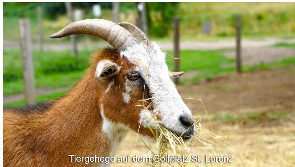
Tiergehege auf dem Golfplatz St. Lorenz