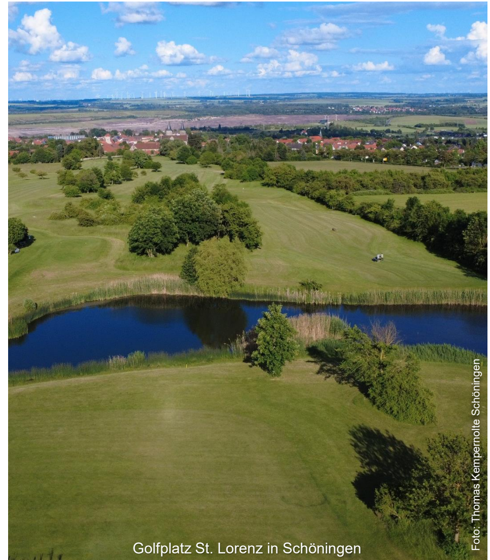
Golfplatz St. Lorenz in Schöningen