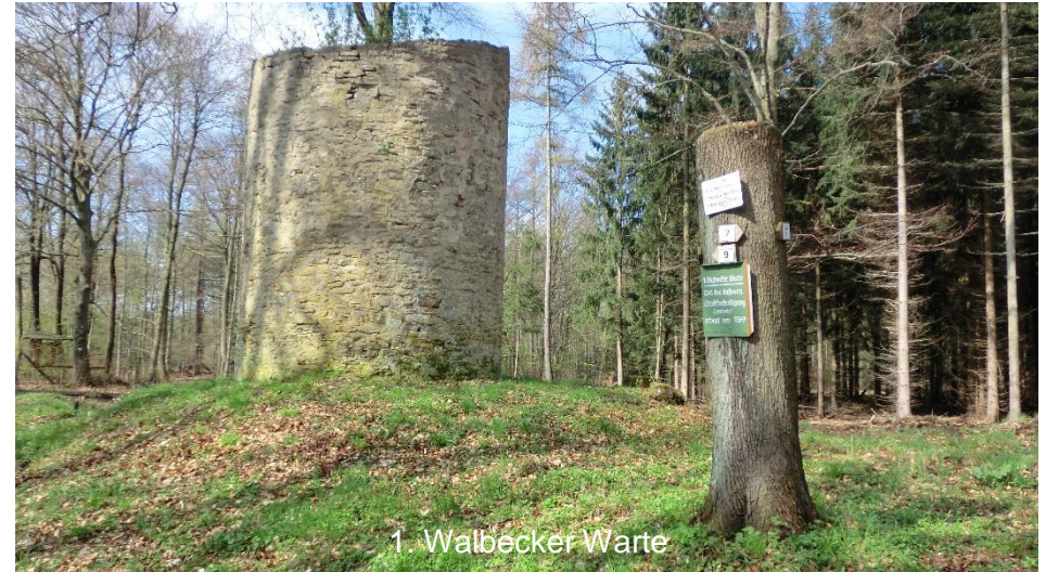
1. Walbecker Warte

Jetzt startet die eigentliche Tour in nördliche Richtung zur nächsten Infotafel an der 1. Walbecker Warte (Stempelstelle 17) . Nach einem kurzen Stopp am ehemaligen Wachturm geht es in zügiger Fahrt weiter zur 2. Walbecker Warte.