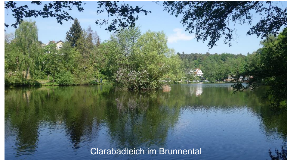
Clarabadteich im Brunntal

Zurück zum Ausgangspunkt der Tour ist es jetzt nur noch ein „Katzensprung“.