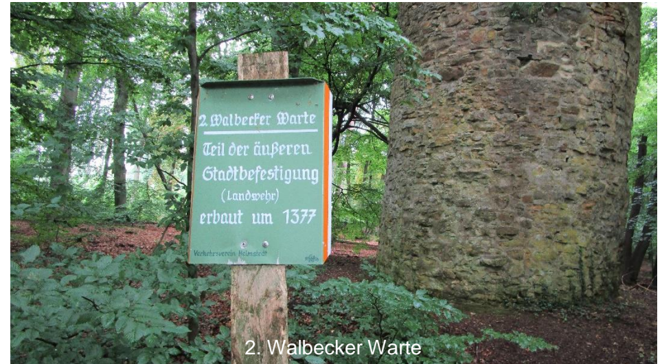
2. Walbecker Warte