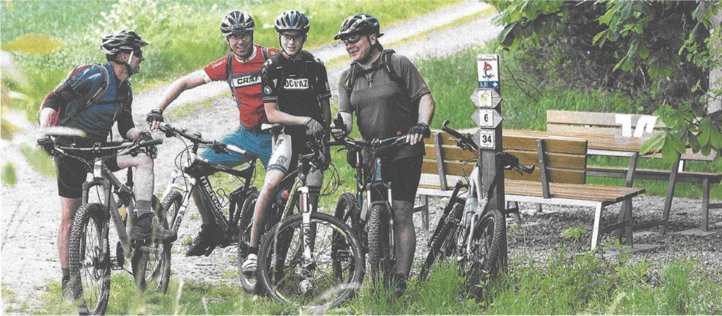
Eine Gruppe von Mountainbikern macht eine Pause am Elmland im Naturpark Elm-Lappwald, für den es ein Tourbuch mit 20 Radtouren gibt.