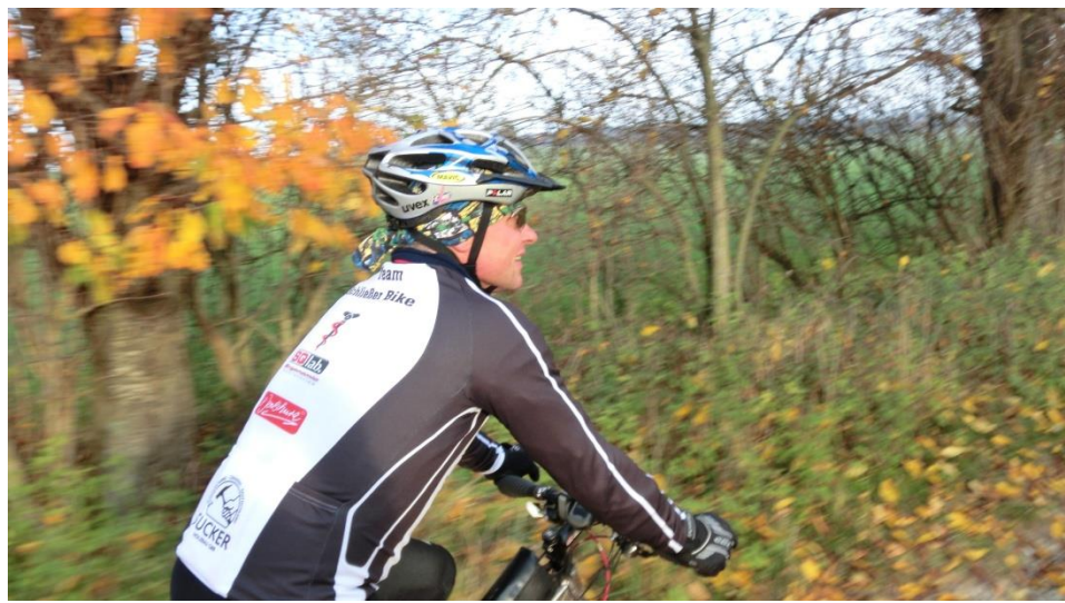
Auf dem Weg zur Heiketalwarte