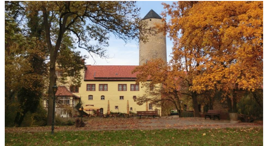
Die Westerburg im Spätherbst