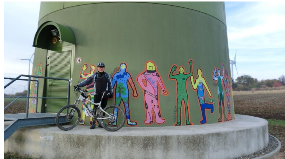
Windpark auf dem Druiberg