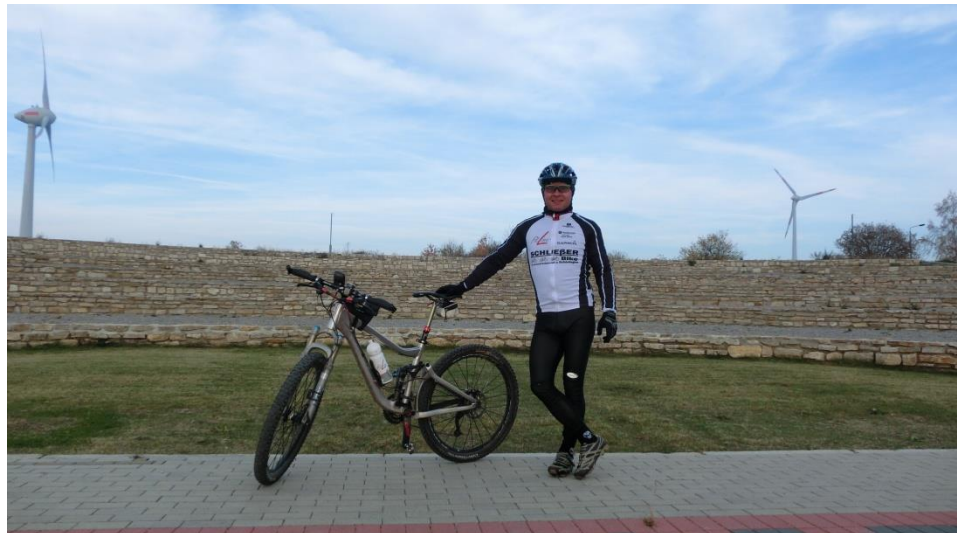
Freilichttheater auf dem Druiberg