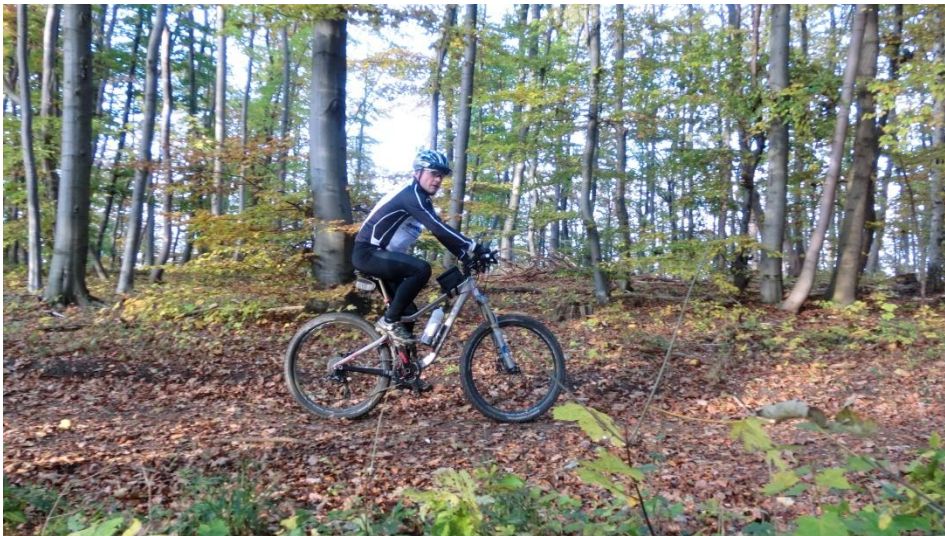
Auf dem Weg zur Sargstedter Warte