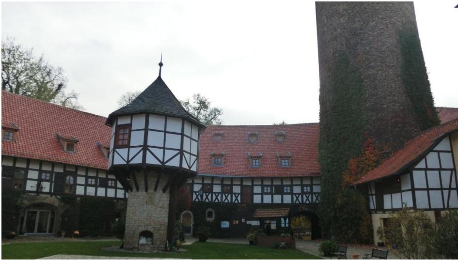
Start der Tour ist an der Westerburg