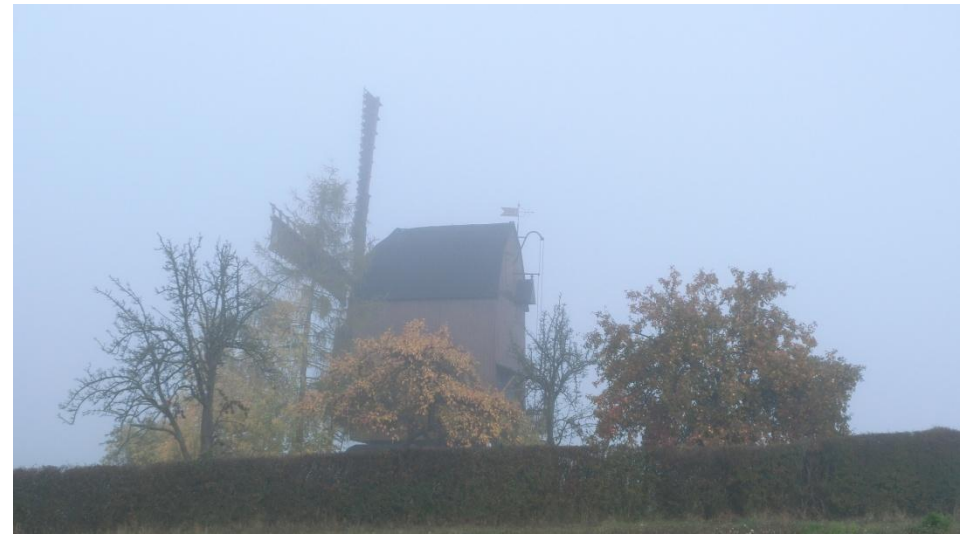
Novembormorgen an der Windmühle in Badersleben