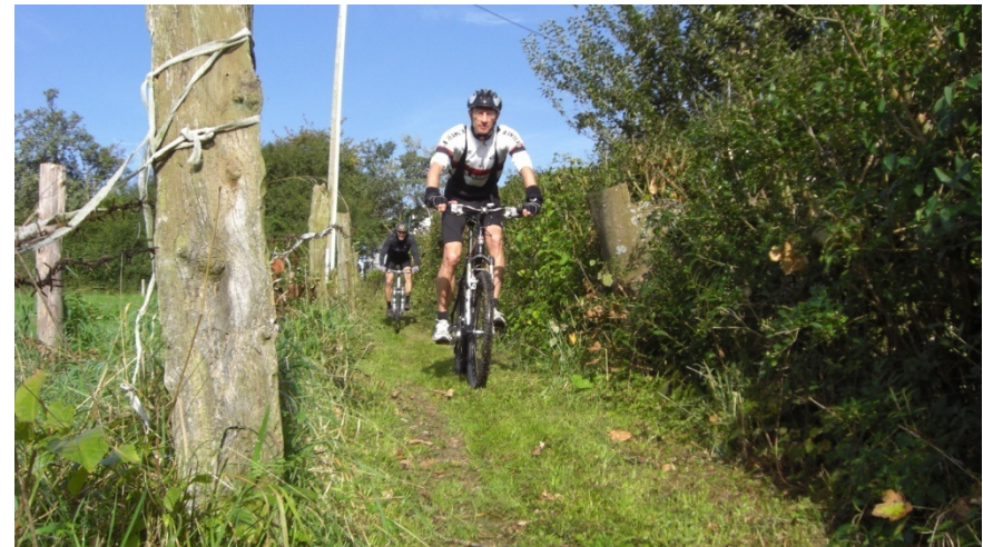
Talabfahrt in Schmitshausen