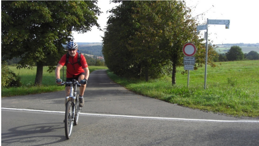
Von Wallhalben nach Schmitshausen