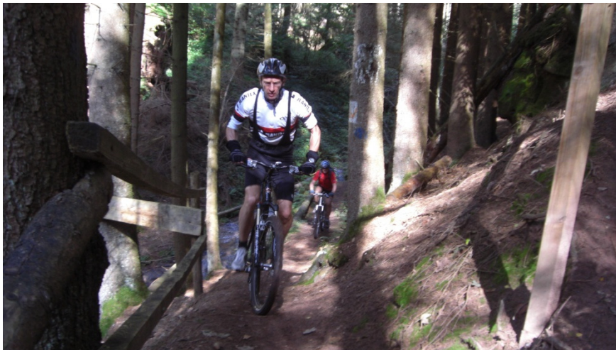
Auffahrt zum Kessel