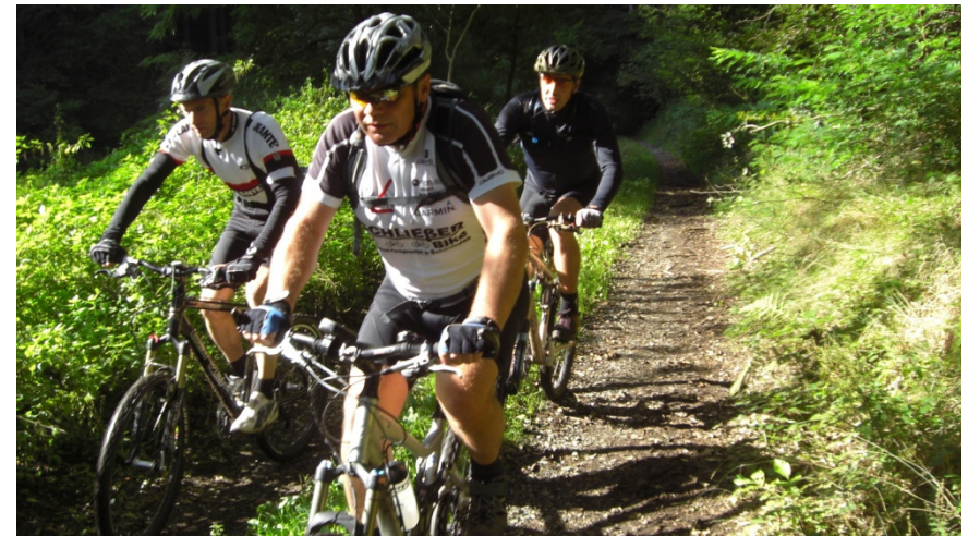
Von der Kneißper-Mühle nach Herschberg

Die Tour beginnt in Wallhalben am Hotel Landgrafenmühle. Es ist eine kurze Rundtour die uns Orte um Wallhalben etwas näherbringt. Um auch den Ansprüchen der Mountainbiker gerecht zu werden, sind einige kurze Trailpassagen in die Tour eingebunden. Aus diesem Grund wird auch Herschberg zweimal durchfahren. Wer diese Tour noch etwas erweitern möchte wird im Wallhalbetal oder rund um den Kessel noch einige interessante Trails finden.