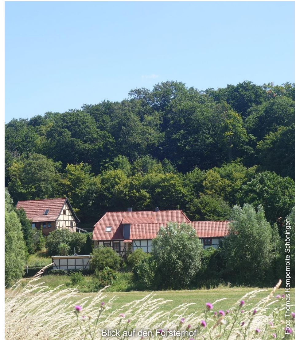
Blick auf den Försterhof