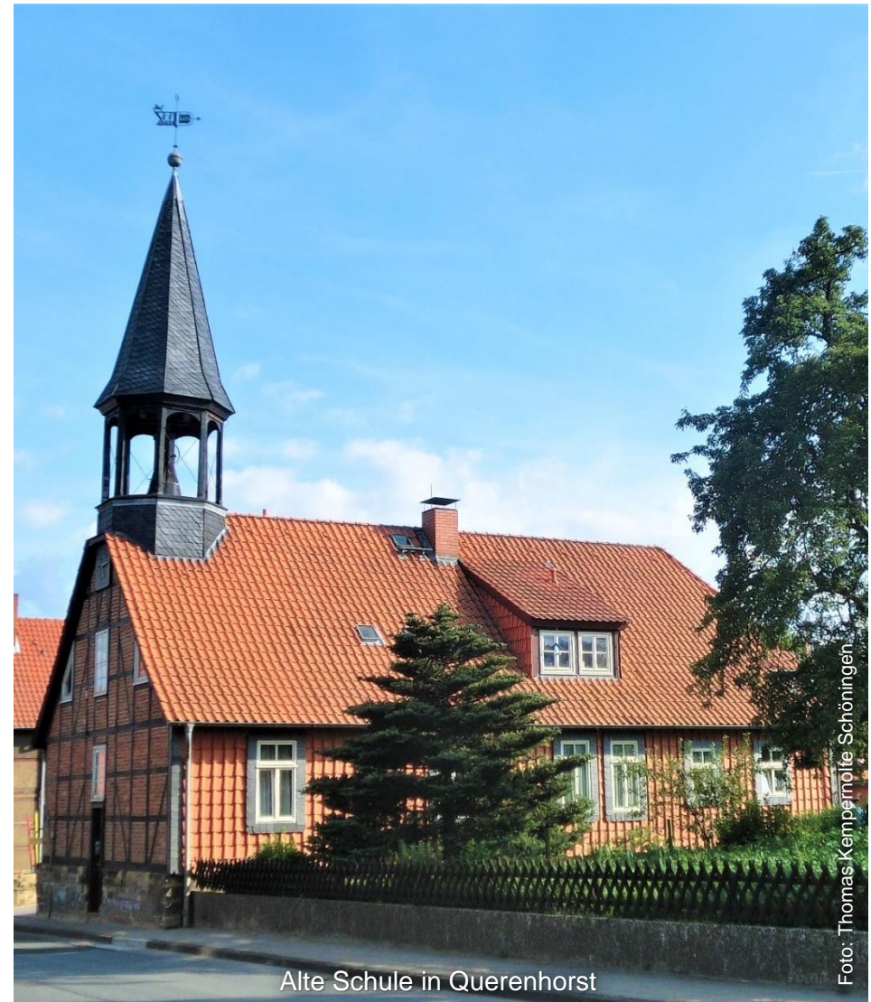
Alte Schule in Querenhorst