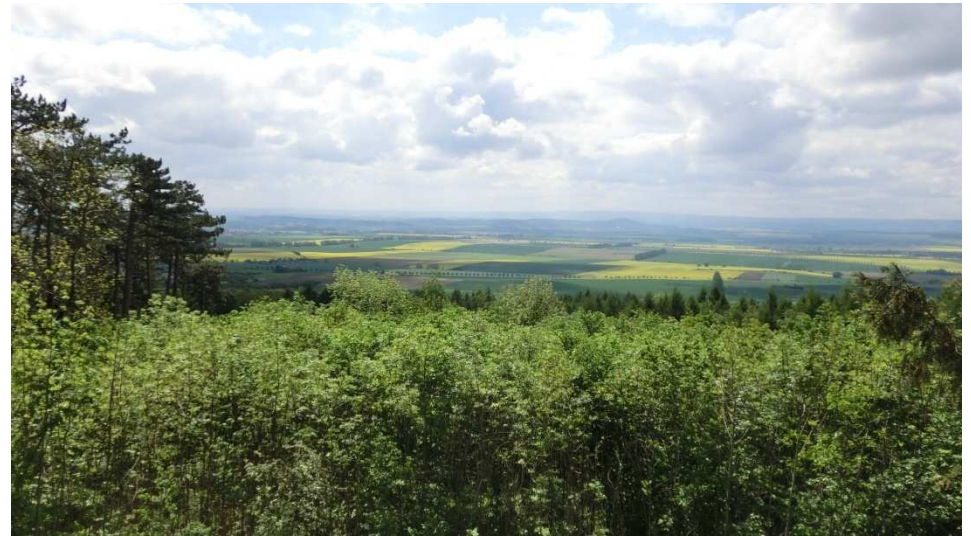
Blick von der Sargstedter Warte