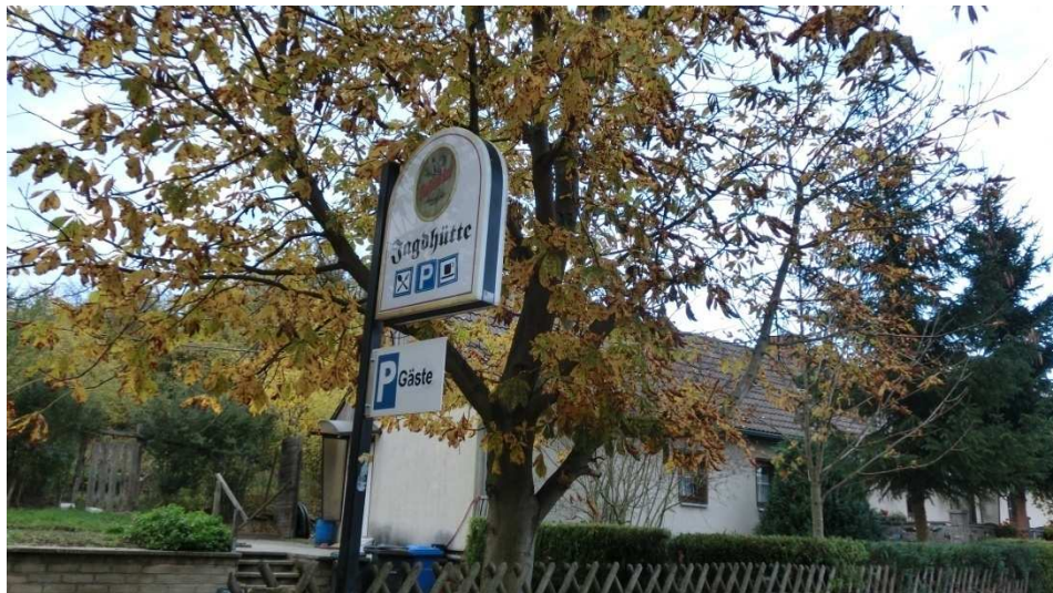
Pause in der Jagdhütte