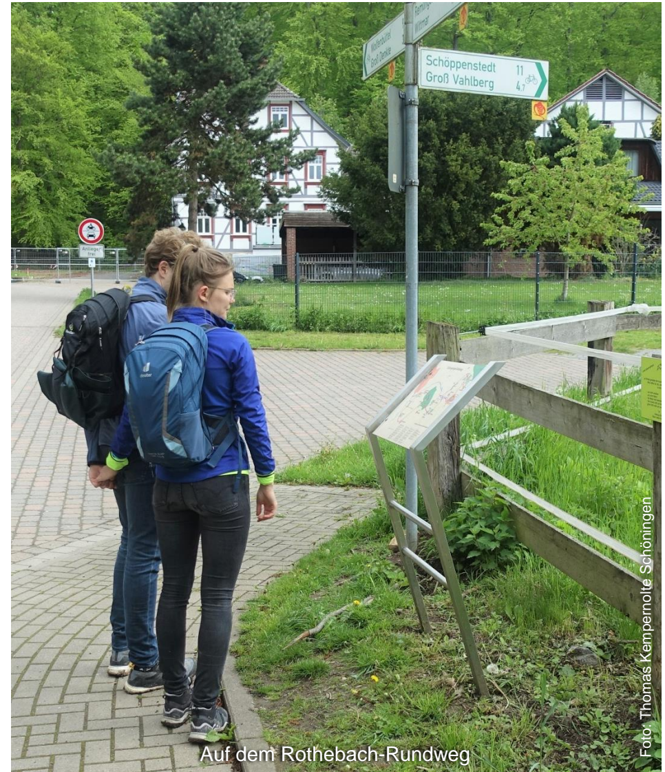
Auf dem Rothebach-Rundweg