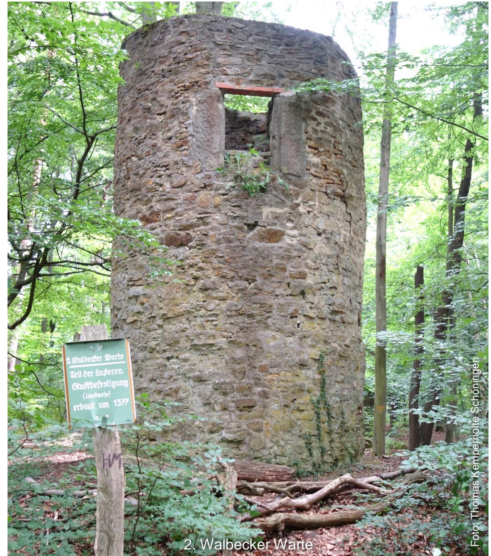
2. Walbecker Warte