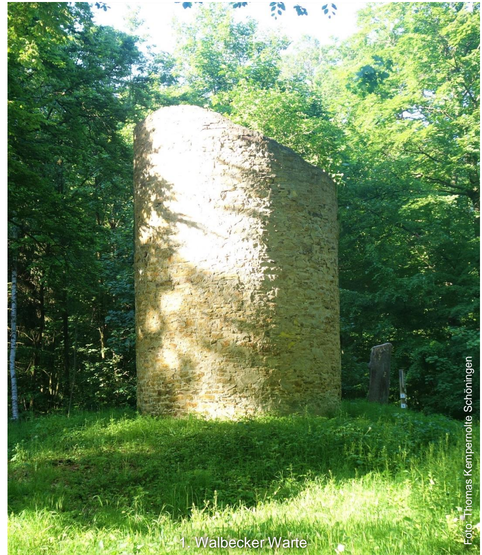
1. Walbecker Warte