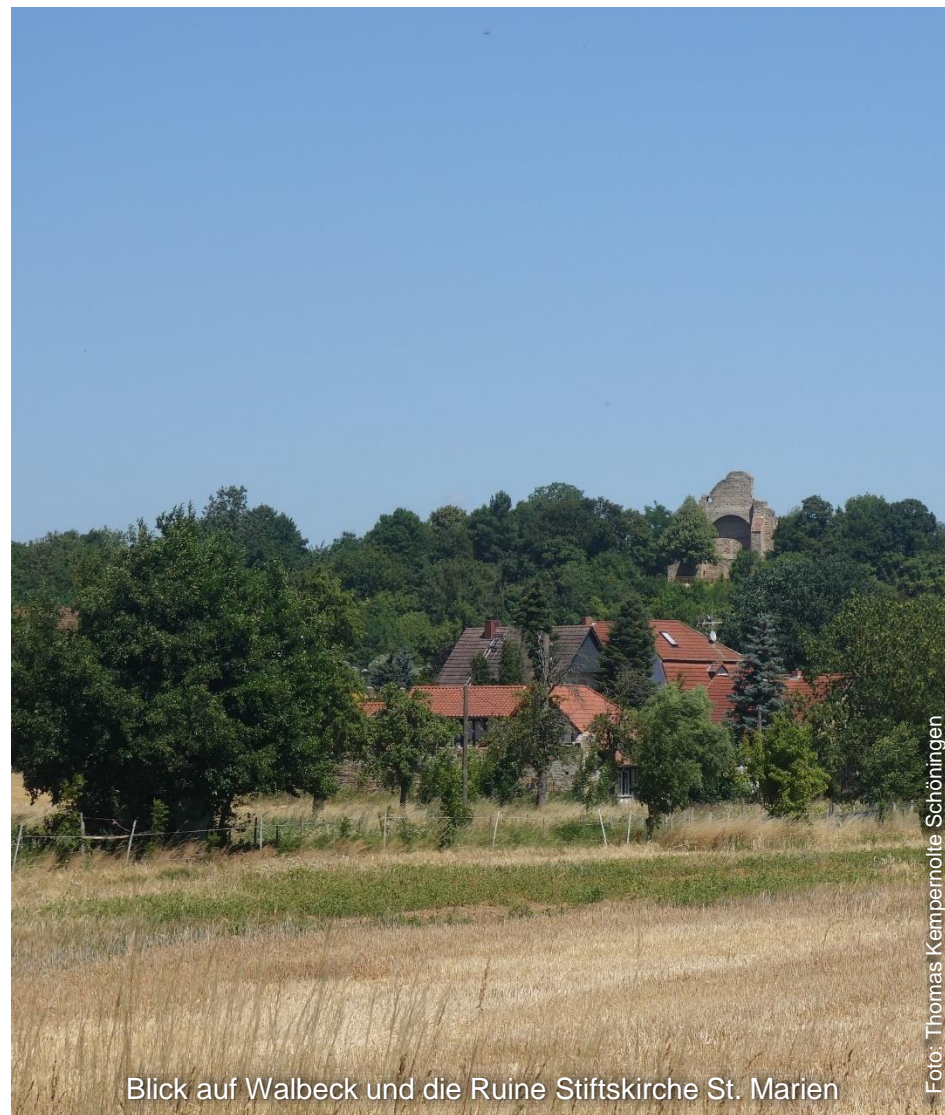
Blick auf Walbeck und die Ruine Stiftskirche St. Marien