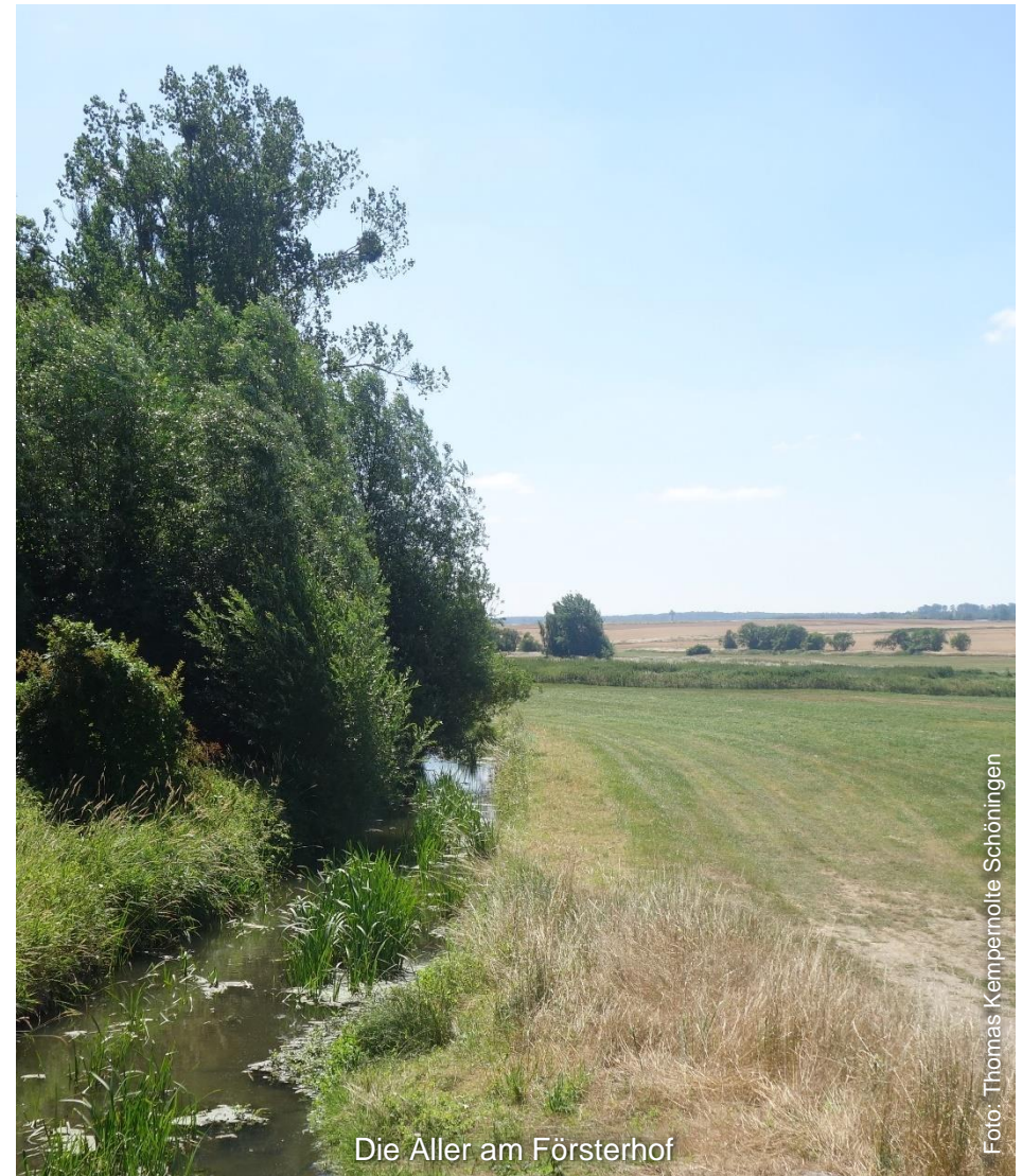
Die Aller am Försterhof