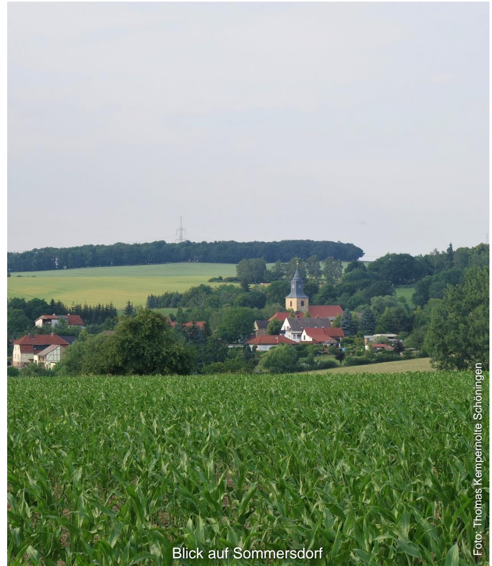
Blick auf Sommersdorf